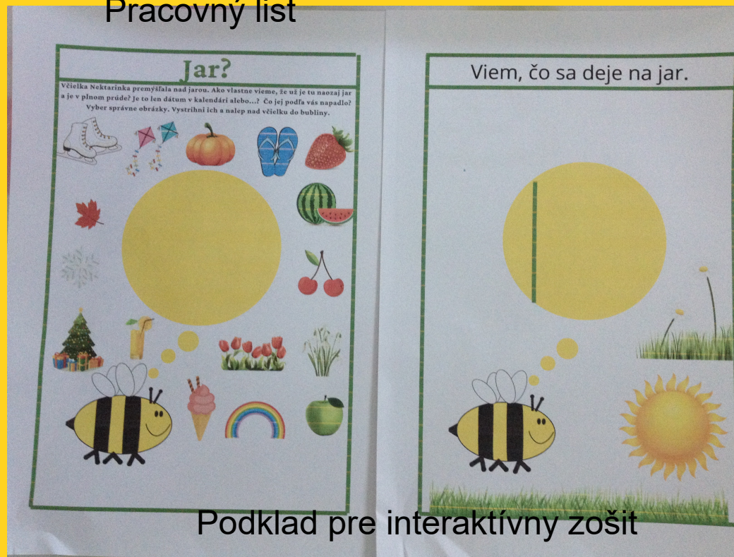
Podklad pre interaktívny zošit